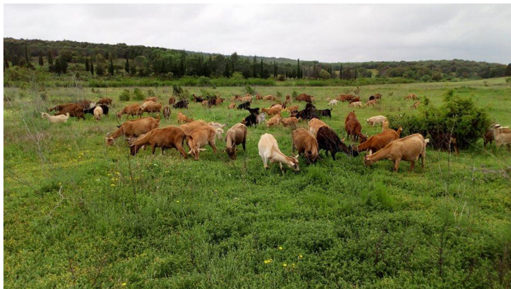
Troupeau de chèvres sur les terres des Quatre-Pilas

La municipalité de Murviel-lès-Montpellier a investi 22 000 € dans le réseau électrique et la rénovation des bâtiments. L'exploitant investit lui dans des aménagements liés à l'installation, notamment un quai de traite et un laboratoire de transformation du lait, grâce à l'obtention d'aides financières en provenance de l'association Airdie 1 , de la fondation Raoul-Follereau 2 et d'un crowdfunding MiiMOSA 3 .